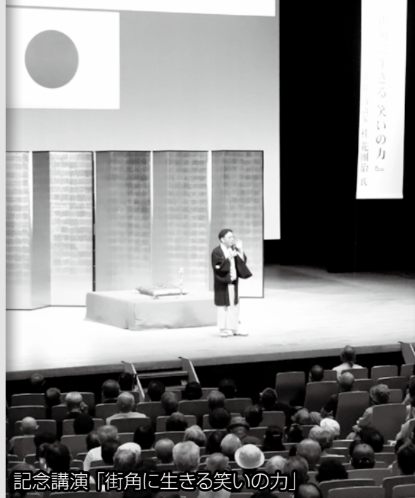
記念講演「街角に生きる笑いの力」