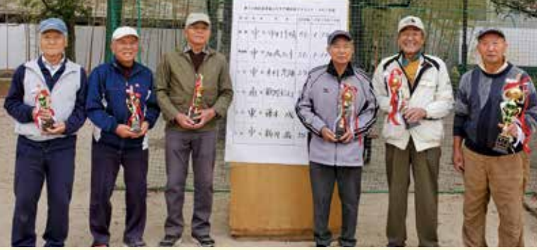
表彰された皆さん揃って笑顔で集合写真。おめでとうございます!