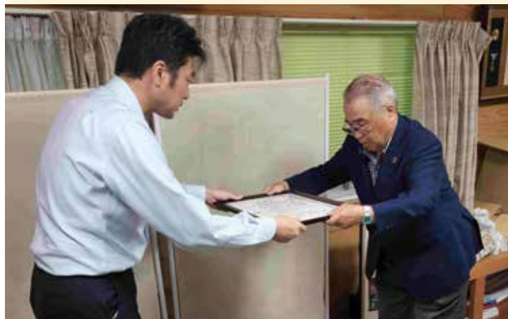
実感en享受することができ、関係者の皆様にご感謝申し上げます。

会所内で平素手が届かない場所や周辺の清掃活動、そして電気、ガス、水道の部品点検、取り換え等を行い、少しでも快適感を味わっていただく活動を行いました。