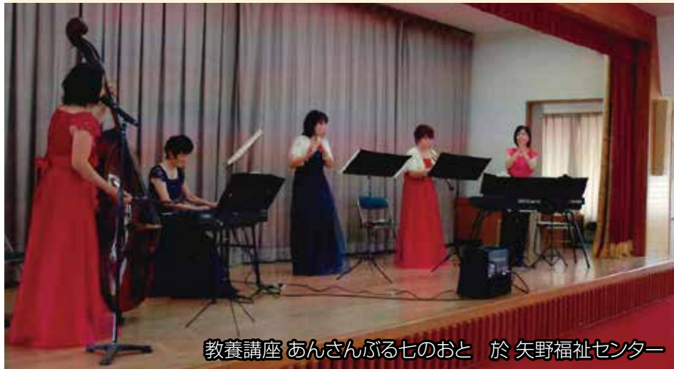
教養講座 あんさんぶる七のおと 於 矢野福祉センター

今回は、二月に安芸区シルバリーダイ交流会での演奏予定。また、女性コーラスの鑑賞講座を予定し、教養を深め楽しい時間と空間を作りたいと思います。