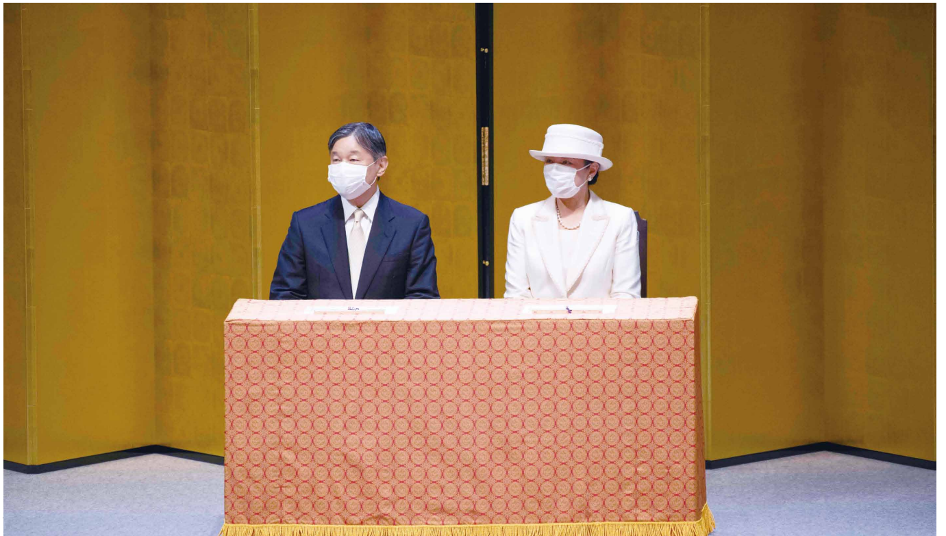
全国老人クラブ連合会創立60周年記念「全国老人クラブ大会」 令和4年11月8日(火) 国技館

〈発行所〉公益財団法人広島市老人クラブ連合会 広島市南区松原町5番1号 〈発行人〉高橋 博 電話(082)207-3850 FAX(082)207-3860 Eメール yuai@rouren.city.hiroshima.jp ホームページ http://www.rouren.city.hiroshima.jp/