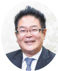
広島市立広島市民病院