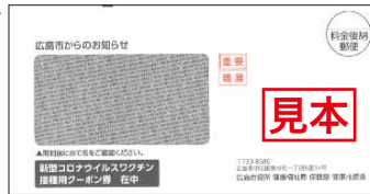
接種用クーポン券送付用封筒

広島市では、5月10日に80歳以上の方へ接種用クーポン券を送付して以降、6月中旬に全ての65歳以上の方へ接種用クーポン券を送付しました。