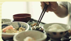
季節の食材が楽しめます