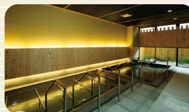
温泉でゆったりリフレッシュ