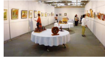
会場の様子(昨年度)

日頃の創作活動の成果、公募作品約200点を展示します。「人生の達人」の皆さんの、心あたたまる力作をぜひご覧ください。入場無料。