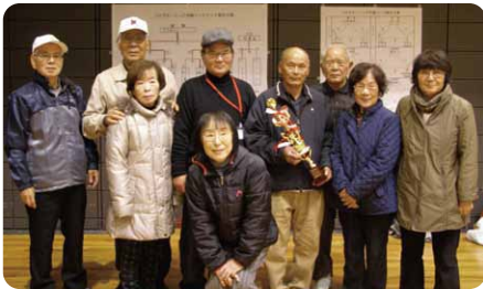
優勝 原百働会A(安佐南区)

参加チーム：24チーム 優勝 楽々園 (佐伯区) 準優勝 倉掛 B (安佐北区) 3位 福田 B (東区) 4位 毘沙門台 A (安佐南区)