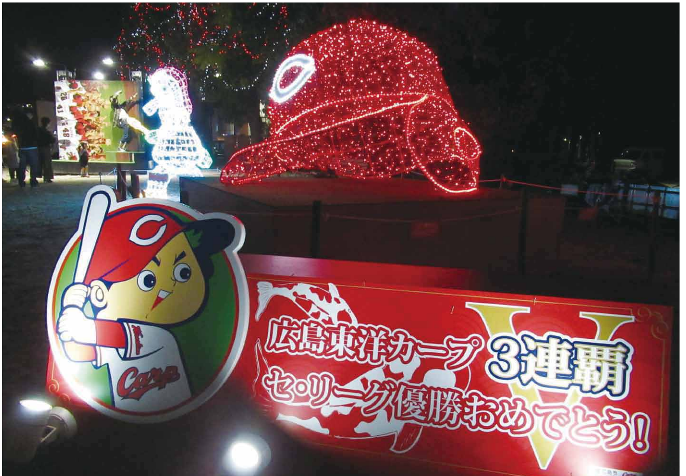
ひろしまドリミネーション2018

〈発行所〉公益財団法人広島市老人クラブ連合会 広島市南区松原町5番1号 〈発行人〉児玉吾郎 電話(082)207-3850 FAX(082)207-3860 Eメール yuai@rouren.city.hiroshima.jp ホームページ http://www.rouren.city.hiroshima.jp/