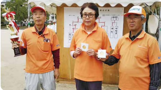
優勝 安北A(安佐南区)

日時：10月11日(木) 場所：新牛田公園 参加チーム：44チーム 優勝 安北 A (安佐南区) 準優勝 福田 E (東区) 3位 瀬野 (安芸区) 4位 中野東 (安芸区)